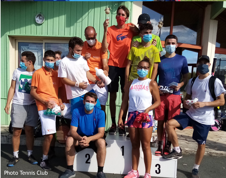
Photo Tennis Club