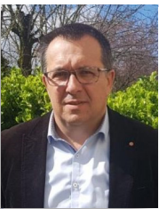
Une ambition commune

En ces temps difficile liés à une crise sanitaire dont nous ne connaissons malheureusement toujours pas la durée ni les conséquences sociales et économiques à long terme, nous ne nous positionnerons pas dans une opposition systématique et stérile mais bien dans une opposition vigilante et constructive dans l'intérêt de toutes et tous d'autant que le projet, la vision à long terme de la majorité pour Pineuilh n'a toujours pas