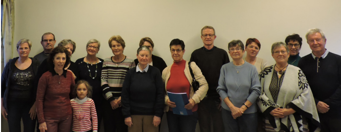
Photo prise avant l'épidémie - Février 2020